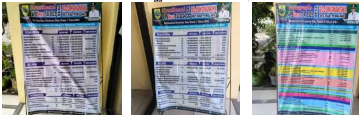
Gambar 2: Publikasi Anggaran Desa Tahun 2023, 2024 dan 2025