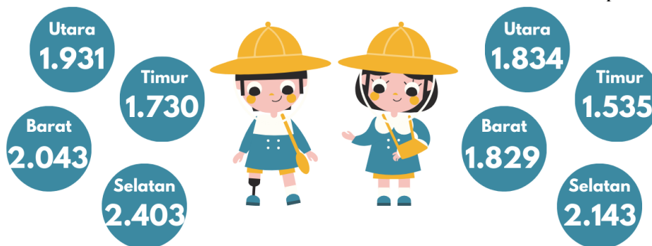
Gambar 2: Jumlah Siswa TK menurut Jenis Kelamin Tahun 2023-2024 per Kecamatan

Secara umum, di semua kecamatan, jumlah siswa laki-laki lebih banyak dibandingkan siswa perempuan. Meskipun ada perbedaan jumlah, partisipasi pendidikan TK menunjukkan tren yang cukup merata dengan distribusi yang tidak terlalu jauh antara kedua jenis kelamin. Denpasar Selatan memiliki jumlah siswa TK tertinggi, diikuti oleh Denpasar Barat, Denpasar Utara, dan Denpasar Timur. Ini menunjukkan variasi dalam partisipasi pendidikan usia dini di berbagai kecamatan, mungkin dipengaruhi oleh faktor demografis, kesadaran pendidikan, dan ketersediaan fasilitas pendidikan.