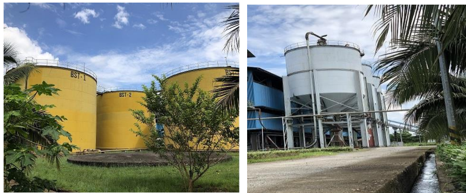
Gambar 17 dan 18. Penyimpanan CPO dan Inti Sawit