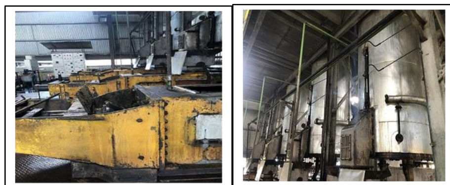
Gambar 7 dan 8. Proses Digesting / Pengadukan TBS

Pada alat ini, brondolan dicincang atau diaduk pada temperature 950 C dengan maksud mengurangi kekentalan minyak dan memudahkan pengempaan. Hasil pengadukan berupa bubur kasar terdiri minyak kasar, air dan masa serat dengan suhu 950 C.