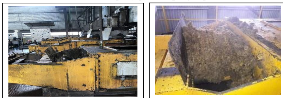
Gambar 9 dan 10. Proses pengepresan / pengempaan brondola

Proses ini bertujuan untuk memeras sebanyak mungkin dari masa bubur secara terus menerus dan dikempa dengan kempa ulir ( screw press ). Pada saat ekstraksi ditambahkan air panas dengan temperature 90 – 950C. Hasil pressan tersebut berupa minyak kasar yang diperoleh dan ditampung dalam crude oil tank dan seterusnya di kirim ke penyulingan minyak ( Clarification ), sedangkan ampas dan biji sawit dikirim ke pemisahan serabut dan biji ( Kernel Plant ).