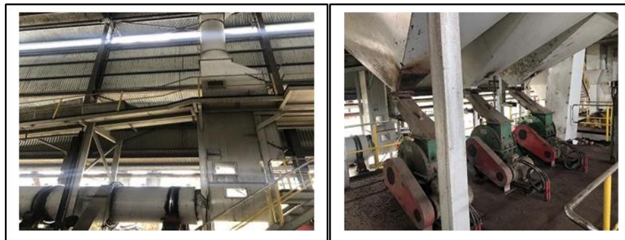
Gambar 13 dan 14. Proses pemisahan serabut – biji dan proses pemecahan nut