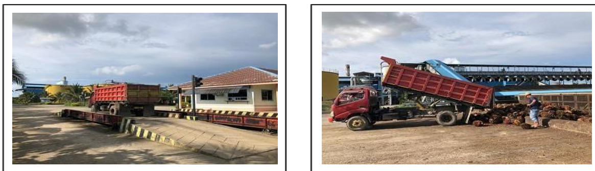
Gambar 2 dan 3. Proses penerimaan Tandan Buah Segar