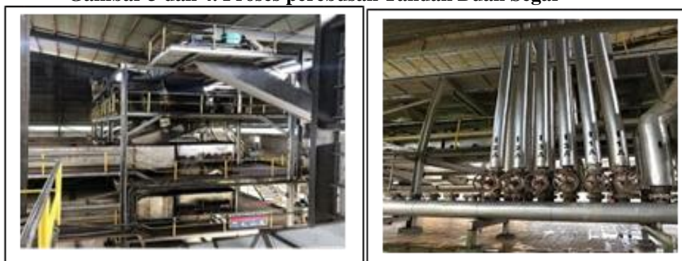
Gambar 3 dan 4. Proses perebusan Tandan Buah Segar

Perebusan TBS berguna untuk memudahkan pelepasan buah dari janjang, melunakkan buah dan mengurangi kadar air dalam buah. Ada 3 (tiga) unit sterilizer dengan kapasitas 30 Ton TBS dengan waktu rebus sekitar 80 menit. Perebusan dengan system continous sterilizer menggunakan uap/steam yang di sprykan ke TBS dengan tekanan 2,00 – 2,40 kg/cm 2 .