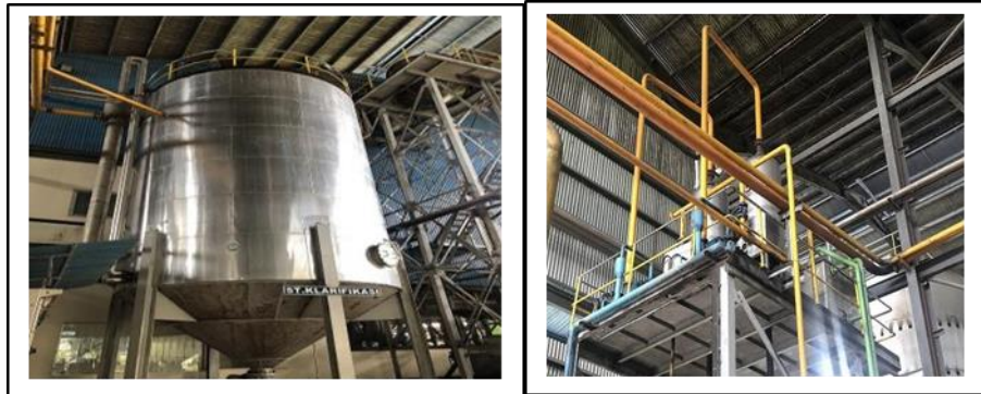
Gambar 11 dan 12. Proses pemurnian minyak

Proses yang terjadi adalah menyuling minyak sebanyak – banyaknya dari minyak encer dan kemudian dibersihkan dan dikeringkan dari kotoran ( dirt ) dan kandungan airnya ( moisture ). Minyak yang dihasilkan selanjutnya ditampung dalam tangki timbun. Proses penyulingan minyak dilakukan pada suhu 90 – 950C.