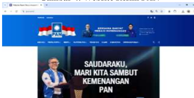
Gambar 4: Website Resmi PAN