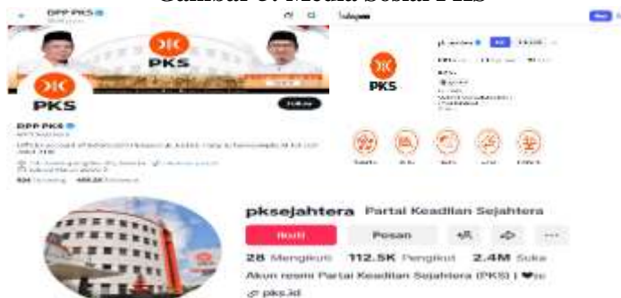
Gambar 5: Media Sosial PKS