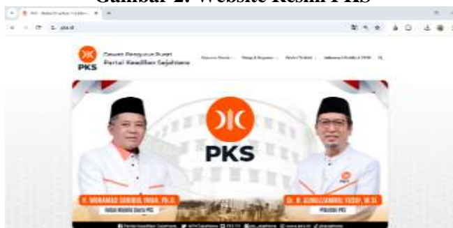
Gambar 2: Website Resmi PKS