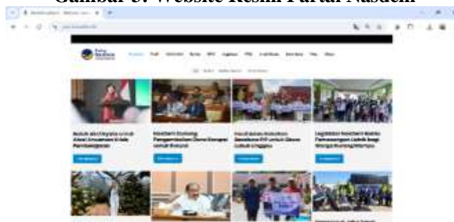
Gambar 3: Website Resmi Partai Nasdem