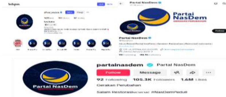
Gambar 6: Media Sosial Nasdem

Dengan demikian, pelembagaan komunikatif PKS tampak bertumpu pada konsistensi identitas institusional. Media sosial berfungsi bukan hanya sebagai saluran penyebaran pesan, tetapi juga sebagai ruang untuk mempertahankan kesinambungan organisasi di hadapan publik. Dalam konteks ini, PKS menunjukkan bahwa media sosial masih dapat dikelola dalam logika yang relatif institusional, di mana partai berupaya menjaga agar komunikasi digital tetap terhubung dengan struktur dan aktivitas organisasinya.